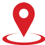
Схема геолокации программы IV Международного гастрономического фестиваля «ASTAUfest» г.Астана, ул. Б.Майлина, 12 «Колледж общественного питания и сервиса»